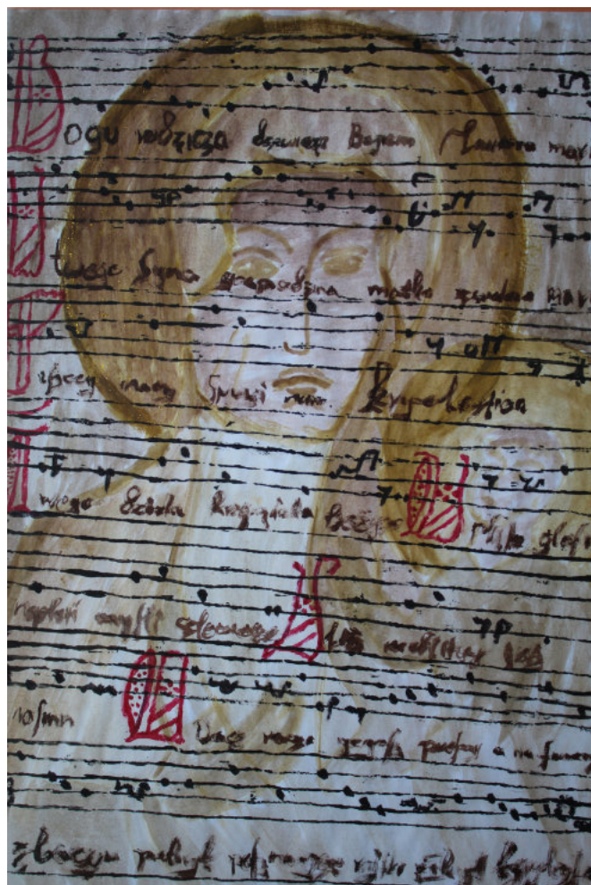
Średniowieczny zapis pieśni Bogurodzica na tle Matki Boskiej - akwarela - wyk. Natalia Komuniecka